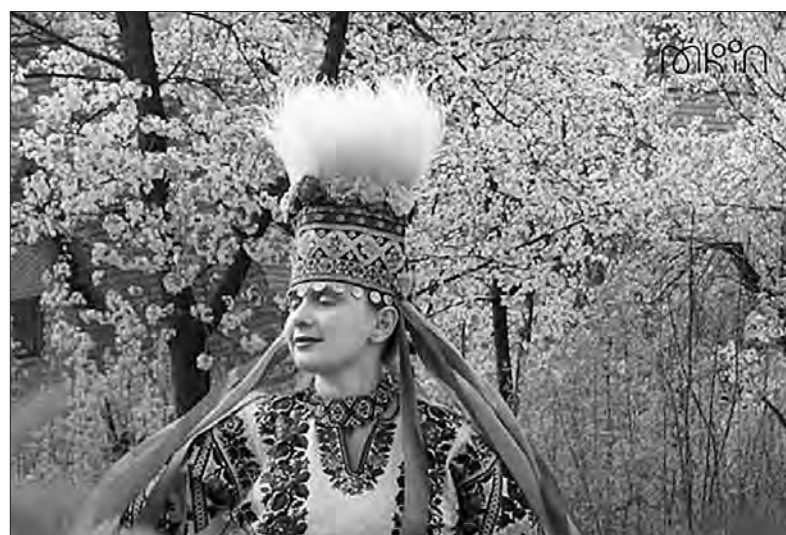
Фото проєкту «Спадщина».