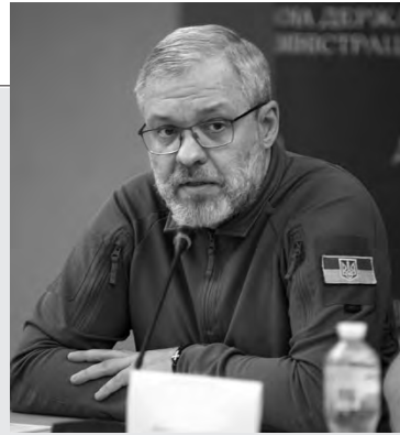
Міністр енергетики Герман ГАЛУЩЕНКО.