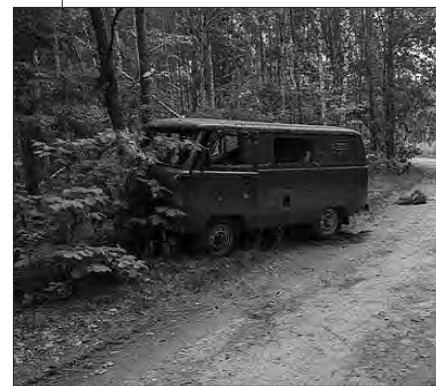
На знімку: в червні ворожа ДРГ розстріляла неподалік Старої Гуті автомобіль із шістьма лісівниками, вони всі загинули.