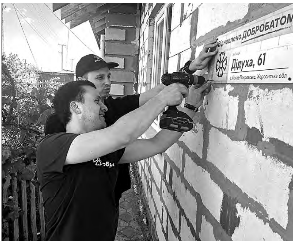
У селі Посад-Покровське — народний депутат Володимир Крейденко та виконавчий директор «Добробату» Дмитро Іванов.